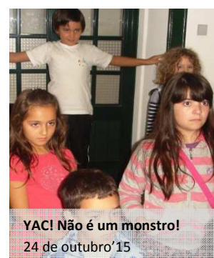
YAC! Não é um monstro! 24 de outubro'15