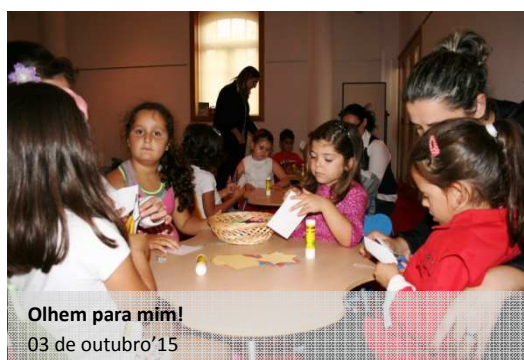
Olhem para mim! 03 de outubro'15