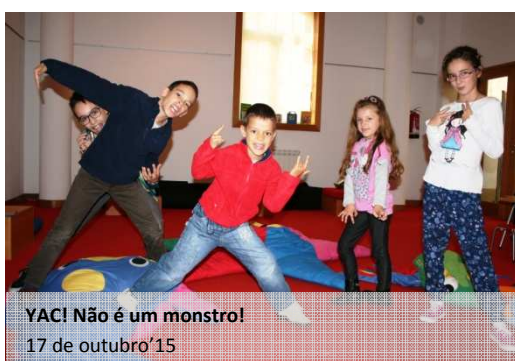
YAC! Não é um monstro! 17 de outubro'15