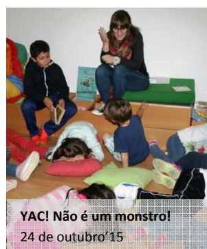
YAC! Não é um monstro! 24 de outubro'15