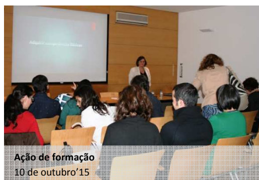
Ação de formação 10 de outubro'15