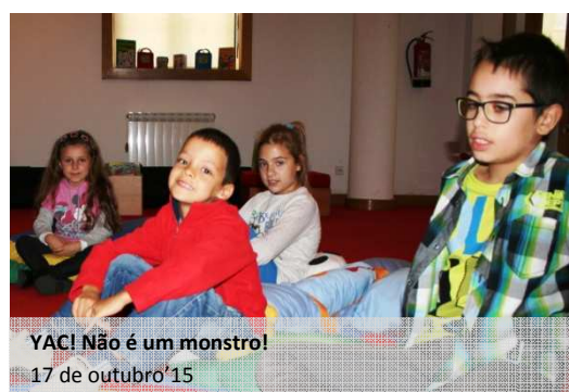
YAC! Não é um monstro! 17 de outubro'15