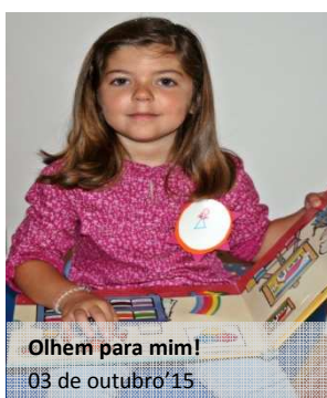
Olhem para mim! 03 de outubro'15