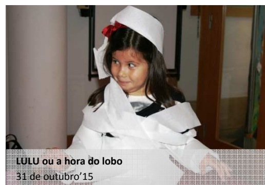
LULU ou a hora do lobo 31 de outubro'15